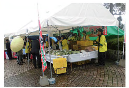
筑紫農協 ゆめ畑さん