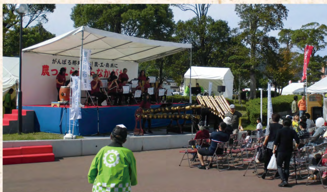
屋外のふれあい公園にステージを設営し様々なイベントを行いました