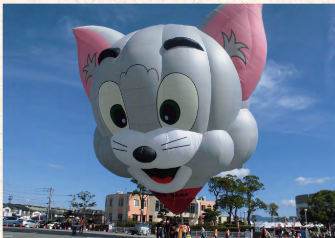
“トム号”のバルーン:参加できた方は数分間の飛行を行いました

本イベントは今回で8回目となりました。本年は佐賀銀行様にご協力いただきアニメ「トム&ジェリー」でおなじみの、ユニークさで人気のあるトムの顔の形をした“トム号”のバルーンを打ち上げました。強風のため11時頃に打ち上げを中止せざるを得なかったものの来場したご家族の方など皆様よりお喜びの声を頂きました。他にもキッズカートや木工体験などのイベントを行い、晴天にも恵まれ盛況のうちに終了しました。