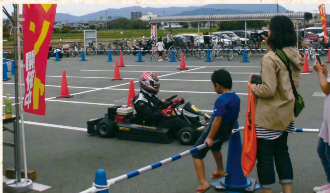
キッズカート:小さいお子様もインストラクターと同乗