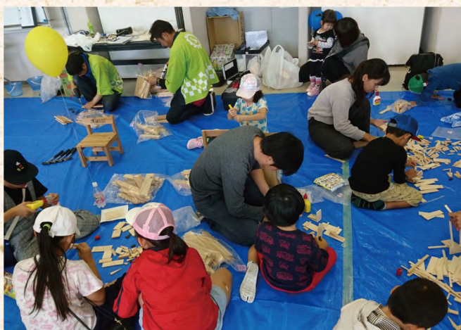
木工体験コーナー:椅子づくりや木片などを使い自由に工作